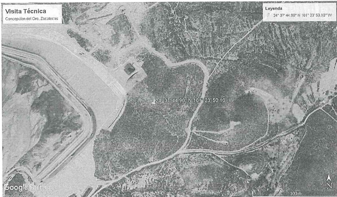
Ilustración 1. Imagen Satelital de la ubicación del predio sujeto a visita técnica, Concepción del Oro, Zacatecas.

**el certificado de transito se encuentra sellado y firmado por la misma empresa Aranzazu Holding S.A. de C.V., debido a que, en el lugar de la comisión, no se encontró autoridad alguna que sellara y firmara el certificado de Transito.