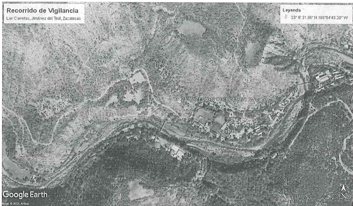
Imagen de la ubicación del lugar objeto del recorrido de vigilancia e instalación de CVAP, Municipio de Jiménez del Teúl, Zacatecas.

**el certificado de transito se encuentra sellado y firmado por el Delegado Municipal de la Comunidad de Las Carretas, Jiménez del Teúl, Zacatecas, sin embargo, no fue posible que se entregara copia de alguna identificación oficial, debido a que al momento de la visita no contaba con ella.