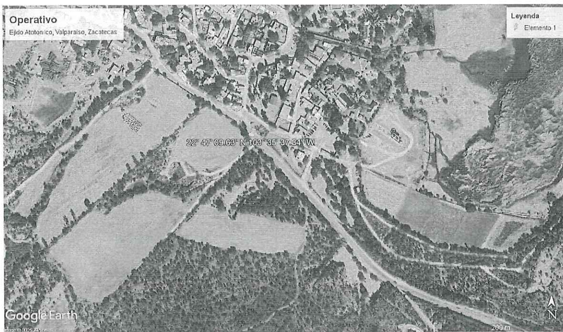
Imagen de la ubicación del Operativo en el Ejido Atotonilco, Valparaíso, Zacatecas.

Declaro, bajo protesta de decir la verdad, que los datos contenidos en este formato son los solicitados y manifiesto tener conocimiento de las sanciones que se aplicarían en caso contrario.