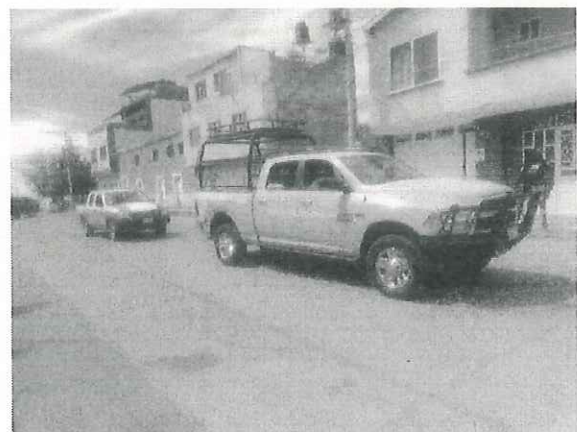
Evento Campaña Estatal de Prevención de incendios Forestales 2025, en el municipio de Valparaíso, Zacatecas