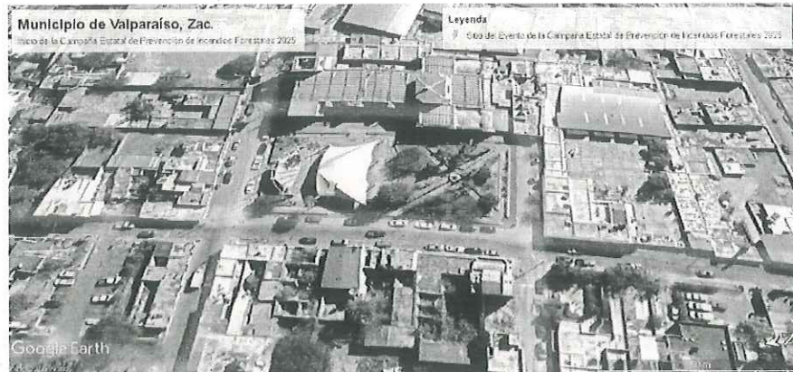
Ubicación del sitio del Evento "Campaña Estatal de Prevención de Incendios Forestales 2025"