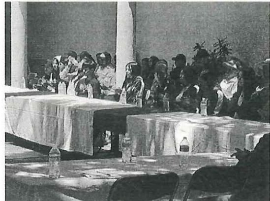
Reunión de Seguimiento de Incendios Forestales 2025