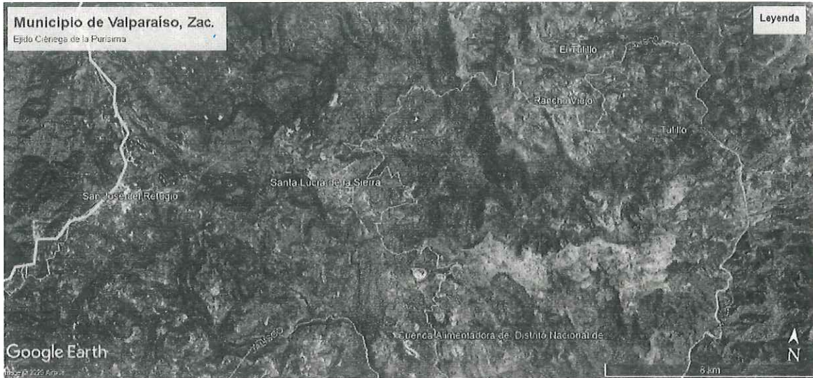
Ubicación del sitio de la Reunión de Seguimiento de Incendios Forestales 2025