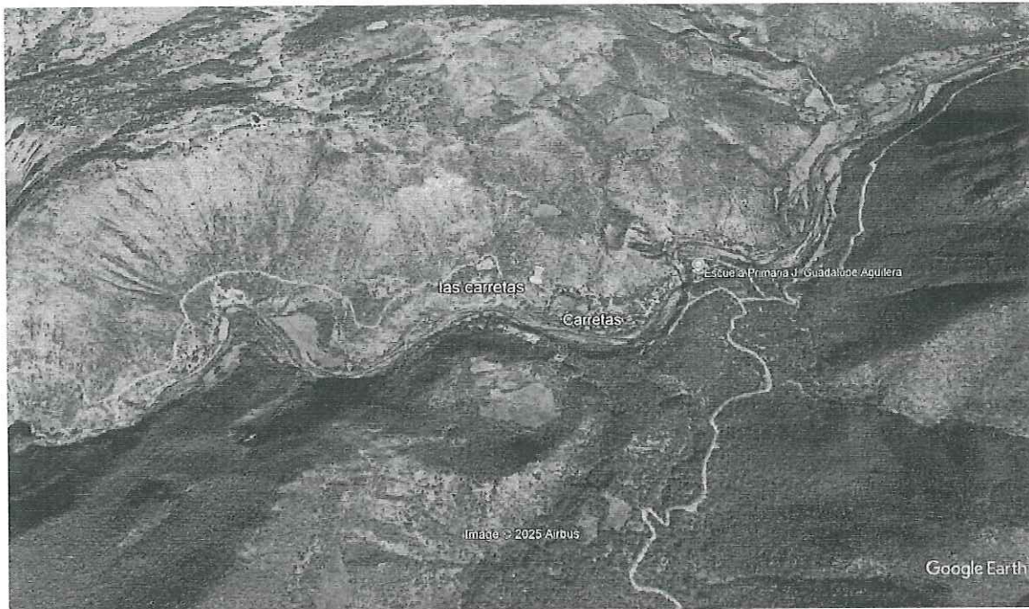
Ilustración 1. Imagen Satelital de la ubicación Las Carretas, Municipio de Jiménez del Teul, Zacatecas.

**el certificado de transito se encuentra sellado y firmado por la autoridad Municipal de la comunidad de Las Carretas, Municipio de Jiménez del Teul Zacatecas, cabe destacar que la autoridad al momento de la visita no contaba con credencial de elector o identificación la cual acreditara su cargo.