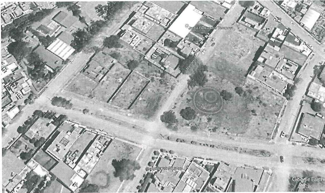
Imagen de la ubicación del lugar objeto de Recorrido de Vigilancia, Cabecera municipal de Jerez, Zacatecas.

**El Certificado de transito se encuentra firmado y sellado por la secretaria del gobierno municipal de Jerez