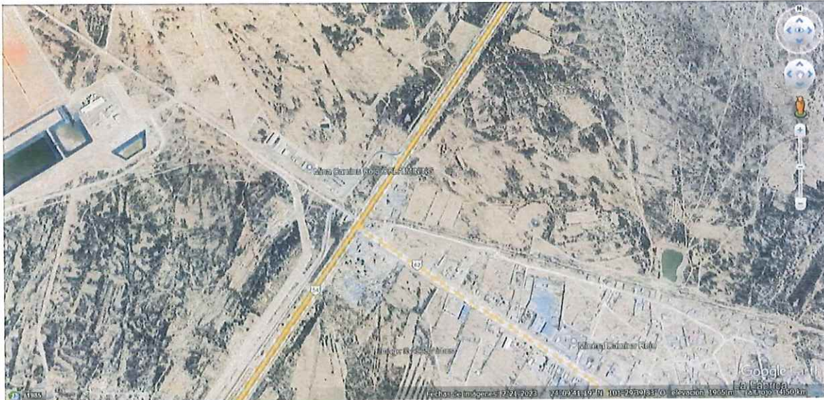
Ubicación de la empresa Orla Camino Rojo, S.A. de C.V. Ejido San Tiburcio, Municipio de Mazapil, Zacatecas