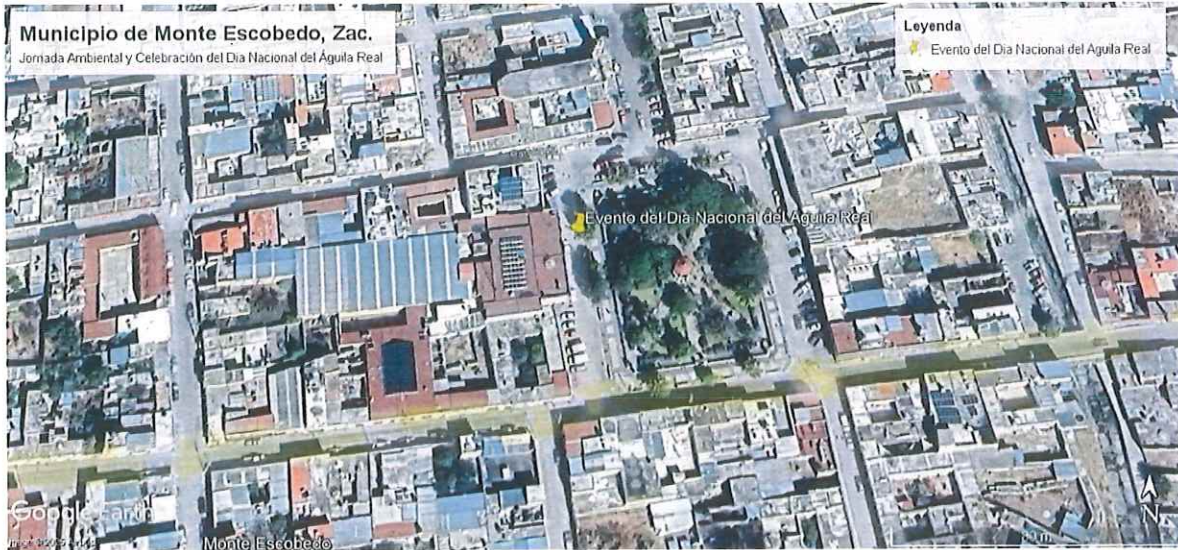
Terrenos donde se realizó el evento del Día Nacional del Águila Real, Municipio de Monte Escobedo, Estado de Zacatecas