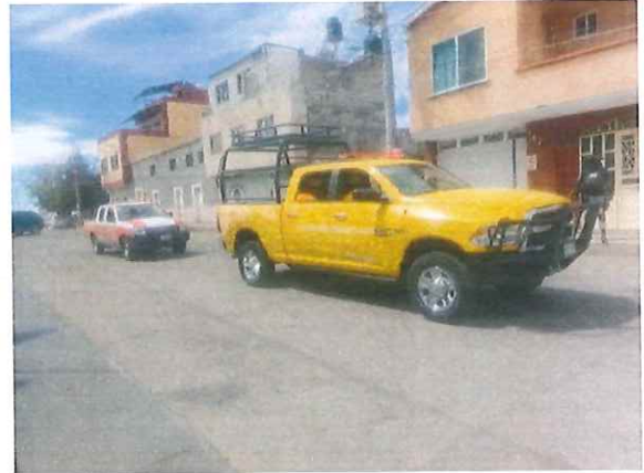
Evento Campaña Estatal de Prevención de incendios Forestales 2025, en el municipio de Valparaíso, Zacatecas