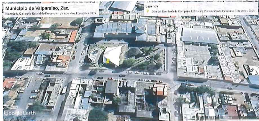
Ubicación del sitio del Evento "Campaña Estatal de Prevención de Incendios Forestales 2025"