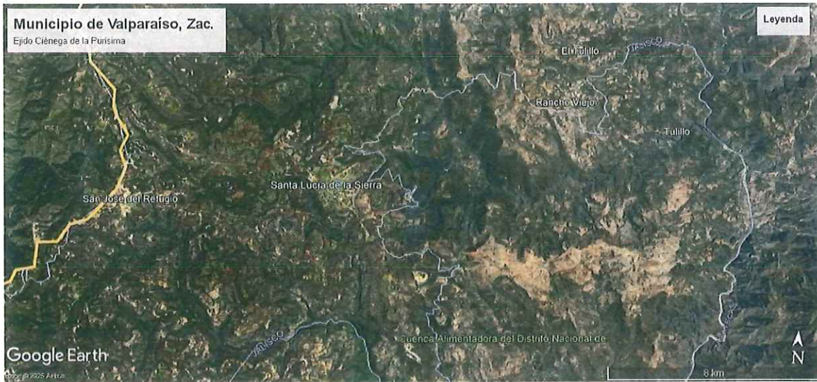
Ubicación del sitio de la Reunión de Seguimiento de Incendios Forestales 2025