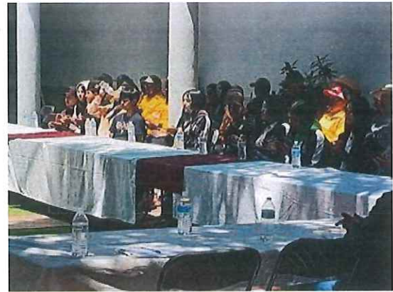
Reunión de Seguimiento de Incendios Forestales 2025