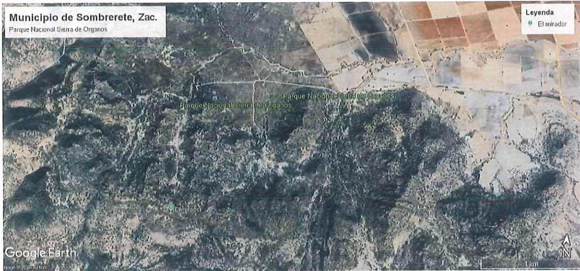
Ubicación del Parque Nacional Sierra de Órganos, municipio de Sombrerete, Zac.