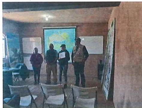
Capacitación y Reintegración del Comité de Vigilancia Ambiental Participativa del Parque Nacional Sierra de Órganos, municipio de Sombrerete, Zac.