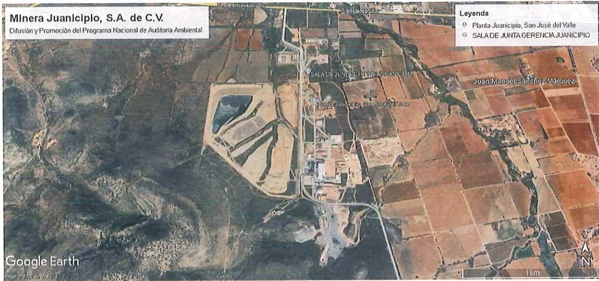
Ubicación de la empresa Minera Juanicípio S.A. de C.V. Municipio de Fresnillo, Zacatecas