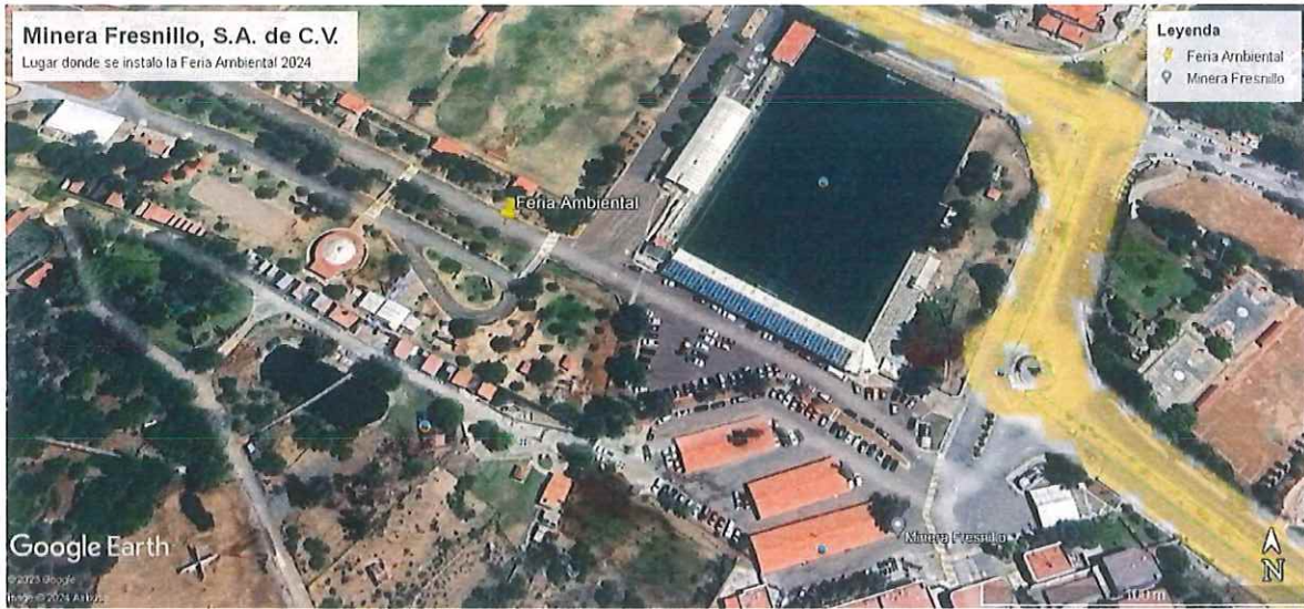
Terrenos donde se ubicó la Feria Ambiental, Municipio de Fresnillo, Estado de Zacatecas