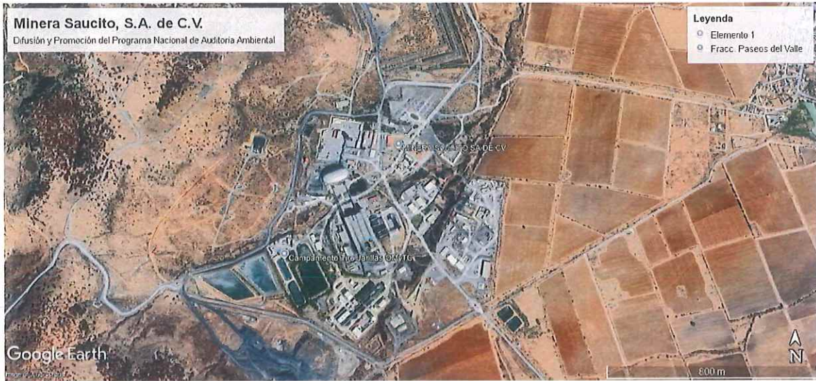
Ubicación de la empresa Minera Saucito, S.A. de C.V. Municipio de Fresnillo, Zacatecas