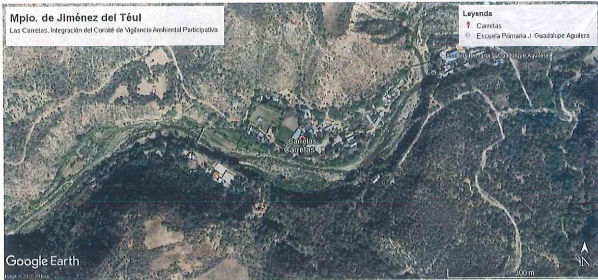
Las Carreteas, Municipio de Jimenez del Teul, Zacatecas