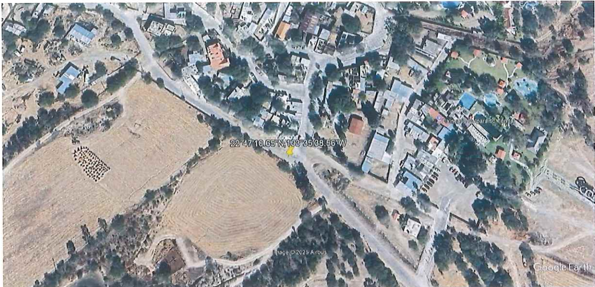
Imagen Satelital de la ubicación del operativo en Materia Forestal en la Comunidad de Atotonilco, Municipio de Valparaíso, Zacatecas.