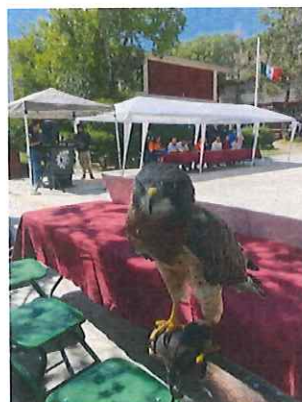
Evento foro Regional Ambiental, en el municipio de Concepción del Oro, Zacatecas

Declaro, bajo protesta de decir la verdad, que los datos contenidos en este formato son los solicitados y manifiesto tener conocimiento de las sanciones que se aplicarían en caso contrario.