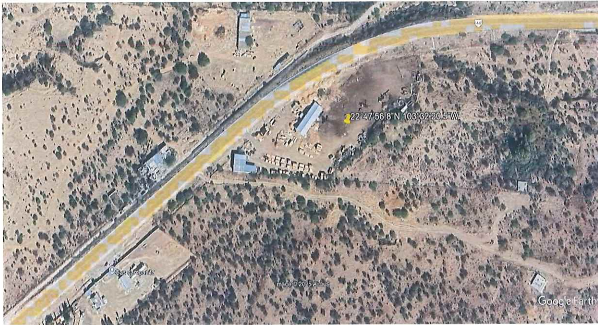
22° 47' 56.8" de latitud norte y 103° 32' 20.5" de longitud oeste y físicamente en Carretera Valparaíso – Fresnillo Kilómetro 3.5, Municipio de Valparaíso, Zacatecas.