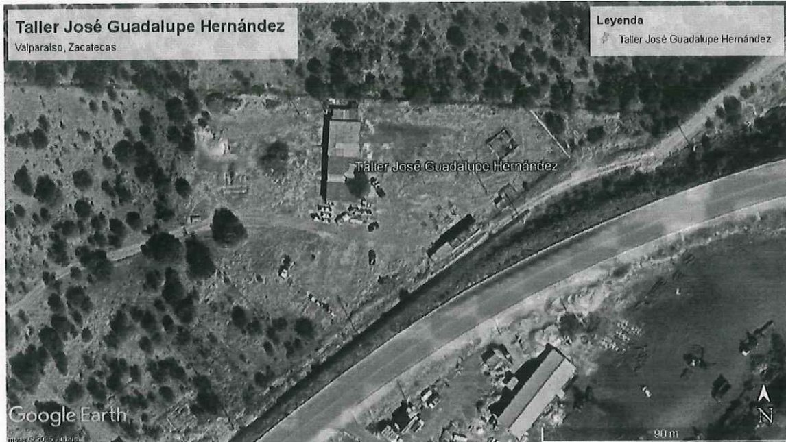
Ilustración 1. Imagen Satelital de la ubicación del predio sujeto a visita en de inspección, Valparaíso, Zacatecas.

**el certificado de transito se encuentra sellado y firmado por el Departamento de Desarrollo Agropecuario y Forestal de la Presidencia Municipal de Valparaíso, Zacatecas, debido a que en el lugar de la comisión, no se encontró autoridad alguna que sellara y firmara el certificado de Transito.